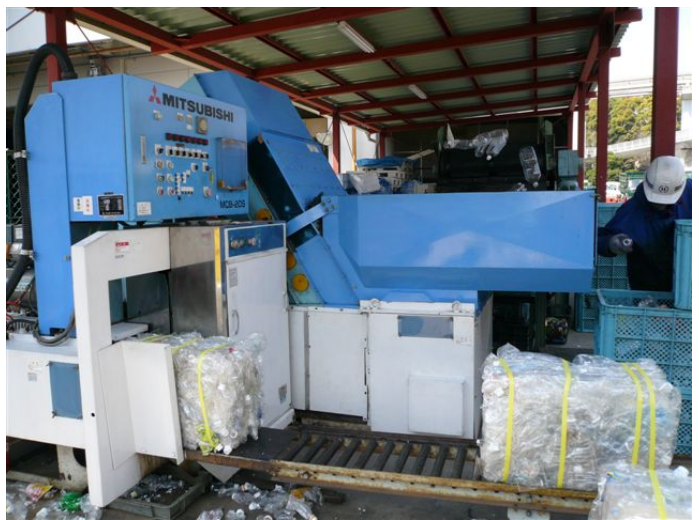
ペットボトル減容圧縮