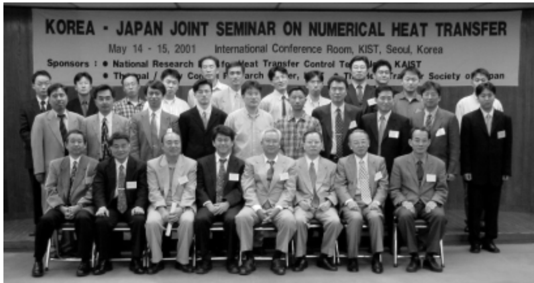
図2 セミナー参加者