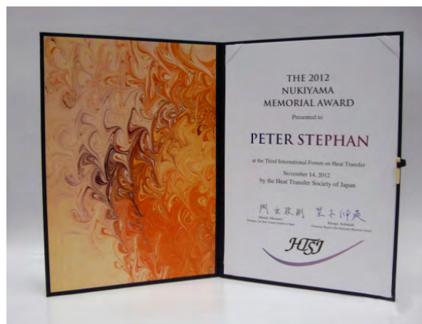
写真 1 抜山記念国際賞の賞状

第 1 回抜山賞受賞者の決定後、受賞者に贈呈される賞状、盾、副賞 (50 万円)、更に受賞者紹介のためのパンフレットの作成に早速取りかかりました。笠木委員長のリーダーシップと吉田委員の献身的な大奮闘で、無事完了し、11 月 14 日の授賞式を迎えることができました。写真 1, 2 は、賞状と盾、写真 3 は、紹介パンフレットの表紙 (中身は、WEB を参照して下さい) です。賞状や盾の制作に当たっては、幸い抜山先生の講義を東北大