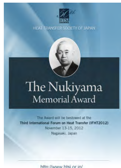
図 1 抜山賞公募の案内

この国際賞の創設は、日本の学会としては画期的かつ先駆的な取り組みとして、国内のマスコミにも取り上げられ、広く発信されました。また熱・エネルギーに関連する国内外の学会にも、この賞の公募案内をしました。国内での発信と並行して、この国際賞が創設されたことを世界中に発信するための活動も始めました。抜山賞の授賞式が 2012 年 11 月に設定されたため、時間的な制約から表 2 に示される日程で早急に活動を開始しました。国際的な発信は、笠木委員長の国際的認知度の高さもあって、International Centre for Heat and Mass Transfer (ICHMT)を始めとして、広く認知されたものと思っています。また、抜山賞案内のパンフレット(図 1)も、Begell 社のご好意で非常に立派なものを作成して頂きました。ここに記して感謝いたします。