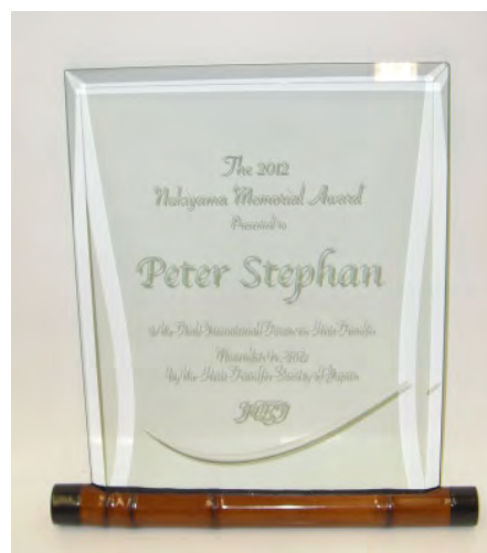
写真 2 抜山記念国際賞の盾