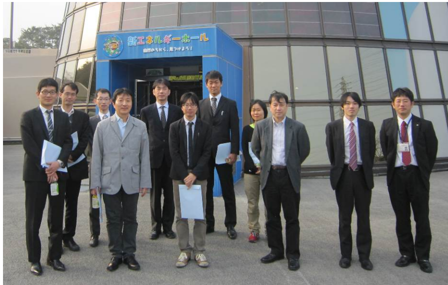
中部電力 浜岡原子力発電所