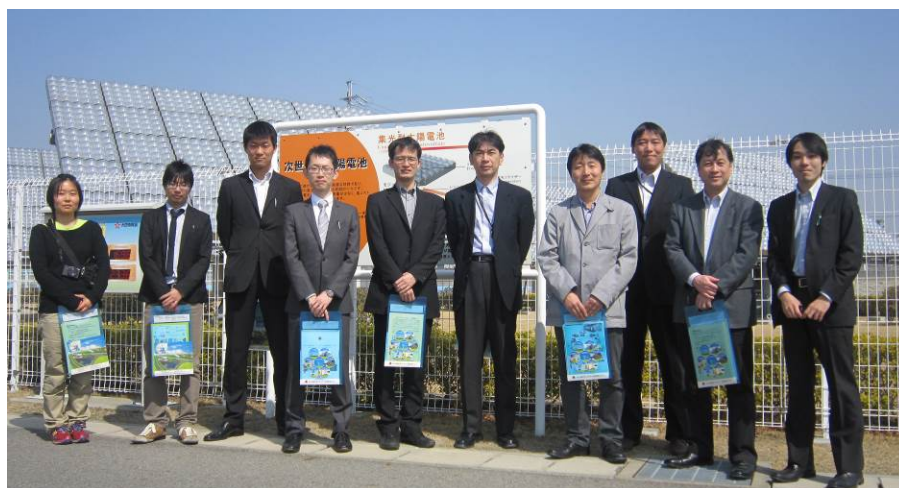
あいち臨空新エネルギー実証研修エリア